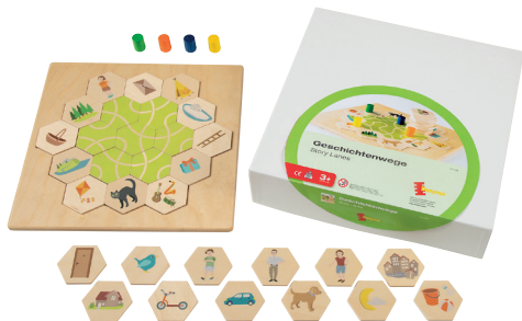
103 484 Geschichtenwege