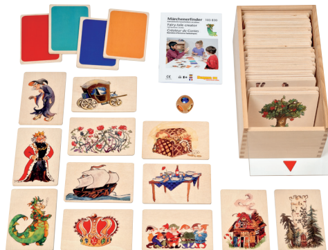
103 830 Märchenerfinder - fantastische Geschichten erzählen