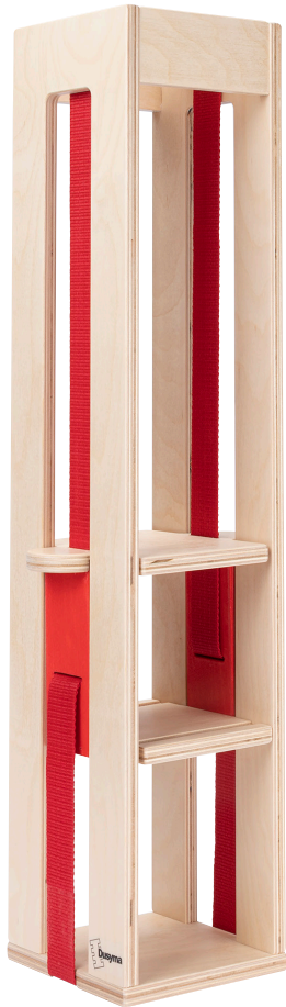
183 194 Park & Build Lift