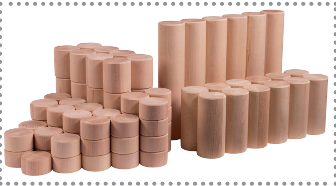
183 202 Uhl Riesen Säulen