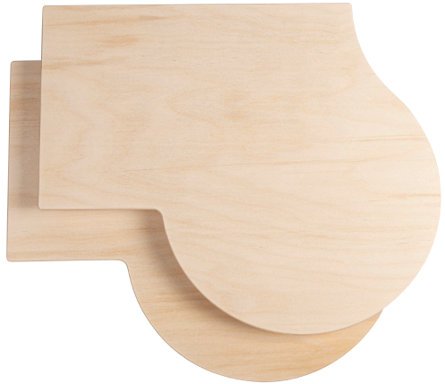
183 193 Park & Build Zubehör | Accessories | Accessoires