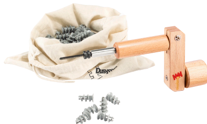
103 732 Dusy-Schrauber Set Dusy-Screwdriver Set | Kit de visseuse Dusy