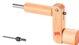
103 734 Dusy-Schrauber Dusy-Screwdriver | Le tournevis Dusy