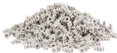
103 733 Dübel Dowels | Goujons