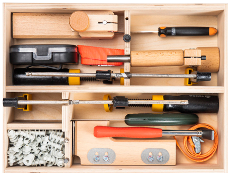
Alles an seinem Platz