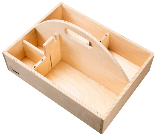
103 552 Werkzeugkiste Tool Box | Boîte d'outils